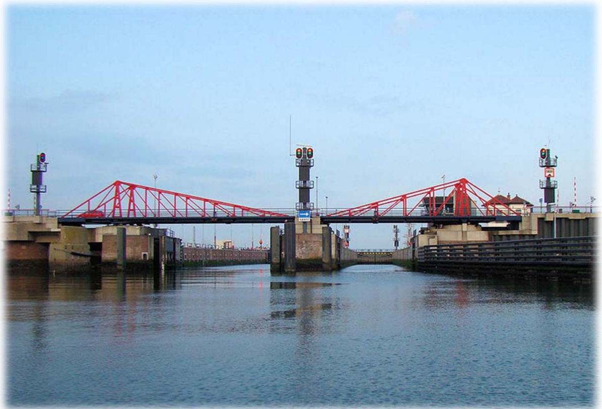
Één van de sluizen in IJmuiden.

Voor de autonavigatie: Steigerweg in IJmuiden.