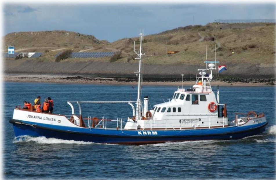
De Johanna Louisa

Er kunnen maximaal 30 personen per keer mee.