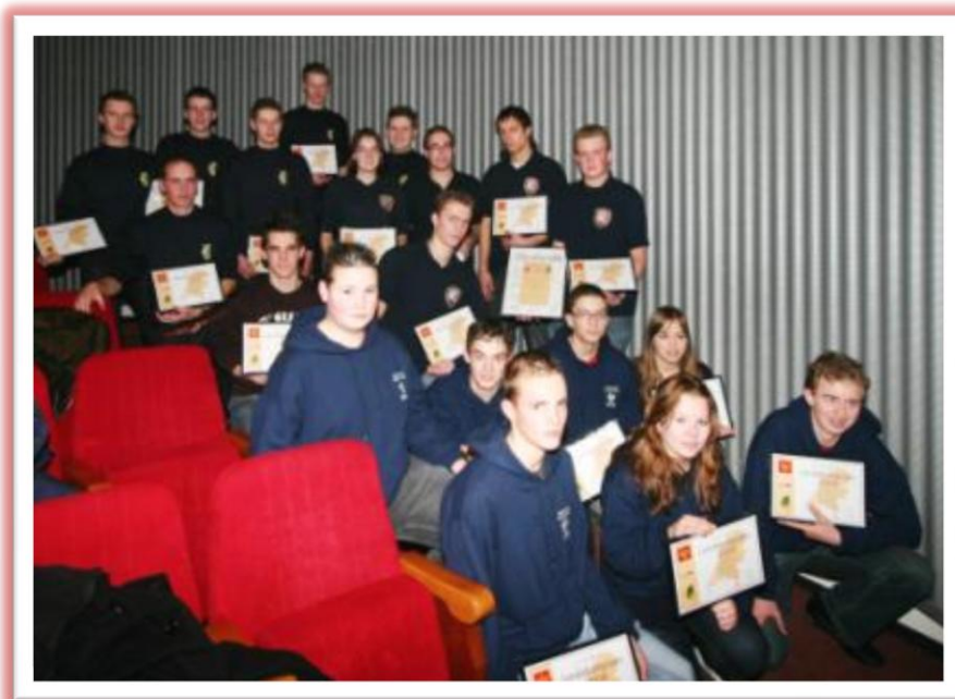
Landskampioenen 2009: Asp-HD: Westerschouwen; Asp-LD: Zwolle; Jun-LD: Middelburg

Deelnemende brandweerkorpsen, juryleden en organiserende brandweerkorpsen zijn zelf verantwoordelijk voor het afsluiten van een ongevalverzekering en een WA-verzekering ten behoeve van schade, letsel e.d. die zij kunnen veroorzaken en oplopen.