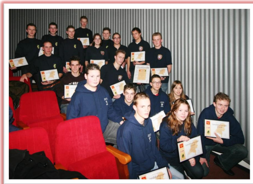
Landskampioenen 2009: Asp-HD: Westerschouwen; Asp-LD: Zwolle; Jun-LD: Middelburg

Deelnemende brandweerkorpsen, juryleden en organiserende brandweerkorpsen zijn zelf verantwoordelijk voor het afsluiten van een ongevalverzekering en een WA-verzekering ten behoeve van schade, letsel e.d. die zij kunnen veroorzaken en oplopen.